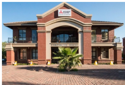
Il South Africa FA Center Satellite, nato in cooperazione con Adroit Technologies

In Italia, la produzione di macchinari elettrici è in ascesa e Mitsubishi Electric prevede un aumento della richiesta di servizi di supporto per i prodotti nel settore dell'automazione. Intanto, il Sudafrica sta conoscendo un periodo di crescita degli investimenti nei progetti di infrastrutture sociali, per cui si prevede un conseguente aumento del numero di costruttori giapponesi e un'espansione dei settori locali quali l'attività mineraria.