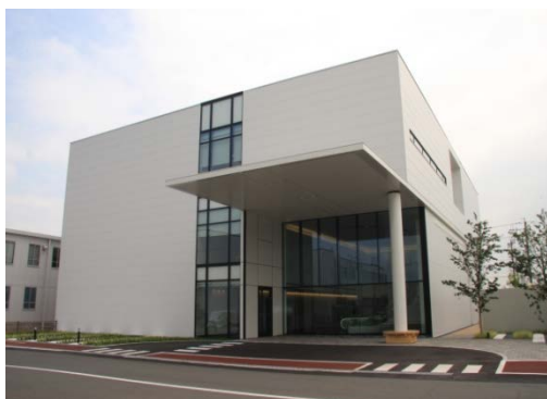
Il nuovo centro di formazione

TOKYO, 30 maggio 2016 – Mitsubishi Electric Corporation (TOKYO: 6503) ha annunciato oggi che il 1° giugno avranno inizio le attività del suo nuovo centro di formazione "SOLAÉ place". La struttura avrà sede presso lo stabilimento Inazawa Works, in Giappone, cuore delle attività di sviluppo e produzione dei sistemi per l'edilizia di Mitsubishi Electric. Il centro è stato creato per rafforzare lo sviluppo delle risorse umane a sostegno dell'ulteriore globalizzazione delle funzioni aziendali di vendita, produzione, installazione e manutenzione dei sistemi per gli edifici, fra cui ascensori e scale mobili.