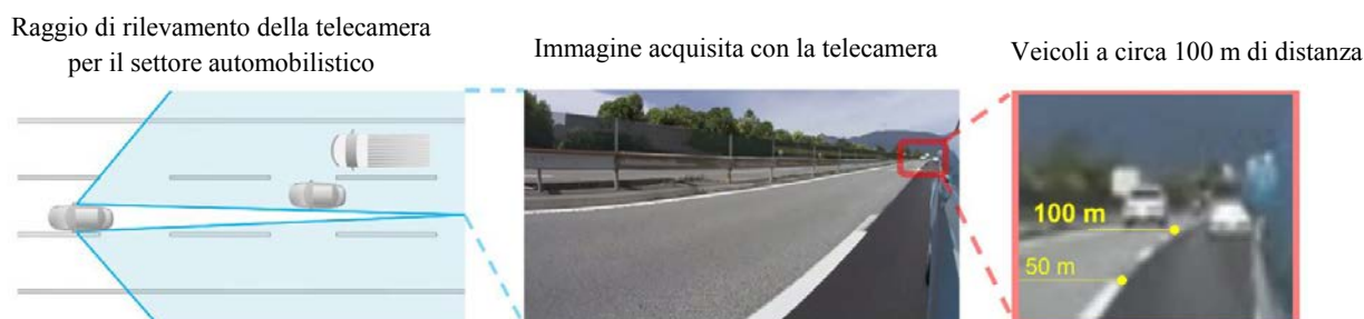
Sistema di monitoraggio con telecamere per vetture senza specchietti retrovisori

TOKYO, 17 gennaio 2018 – Mitsubishi Electric Corporation (TOKYO: 6503) ha annunciato oggi di avere sviluppato la tecnologia per telecamere per il settore automobilistico, che si ritiene offra le massime prestazioni del mercato e che è in grado di rilevare vari tipi di oggetti a distanze fino a 100 metri; questa tecnologia sarà in grado di inviare avvisi avanzati ai conducenti, per garantire una migliore sicurezza di guida delle vetture senza specchietti retrovisori. La soluzione si basa sulla tecnologia di intelligenza artificiale (IA) a marchio Maisart, di proprietà di Mitsubishi Electric, e si prevede che aiuterà a prevenire gli incidenti, in particolare in fase di cambio corsia da parte dei conducenti. Le vetture senza specchietti sulle quali gli specchietti retrovisori e laterali vengono sostituiti da sistemi di monitoraggio con telecamere, sono state approvate per l'uso in Europa e in Giappone nel 2016; si prevede che le prime vetture senza specchietti retrovisori per la distribuzione commerciale saranno lanciate in Giappone già nel prossimo anno.