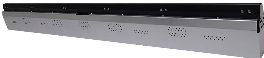
Modello KD6R1064CXF-NL nella nuova serie KD-CXF

La massima profondità di campo del settore; ideale per l'ispezione di superfici di svariati oggetti in produzione