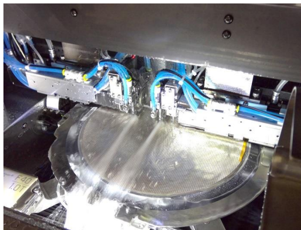
Lavorazione dei wafer Si da 12 pollici per la produzione di chip

Si prevede che la fornitura costante di chip per semiconduttori sia di sostegno alla cosiddetta transizione verde